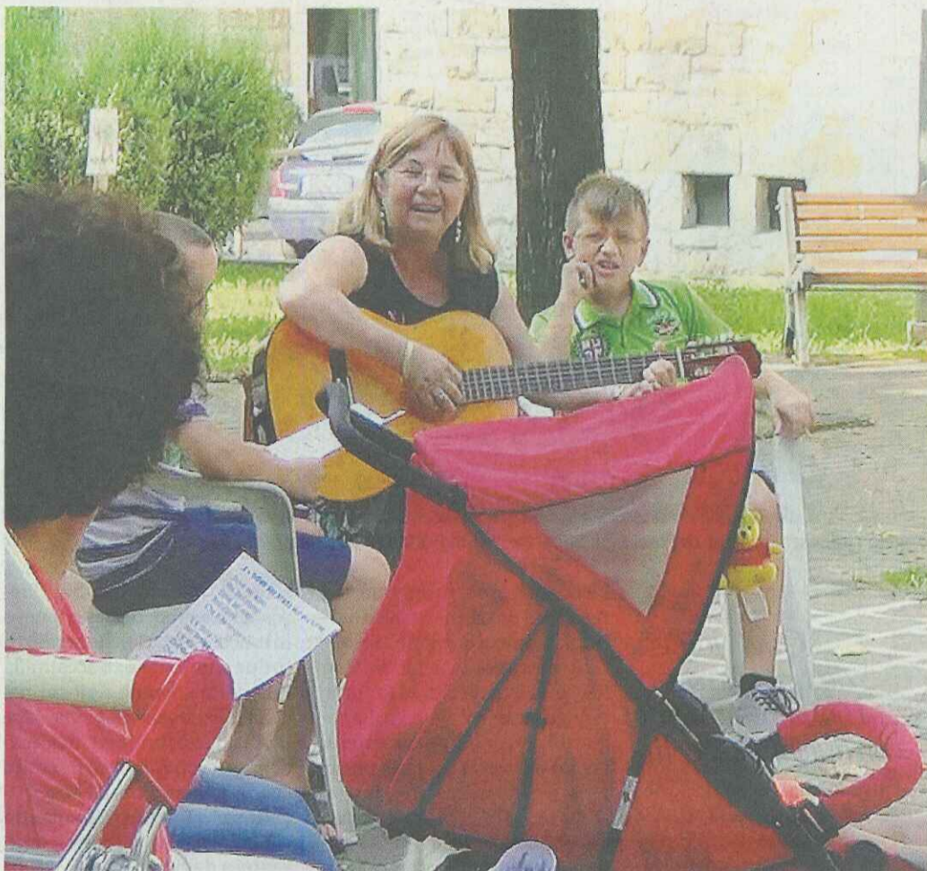
Festa nel cortile: domani la proiezione del documentario

Un progetto portato avanti per 12 mesi, come per un vero kolos-